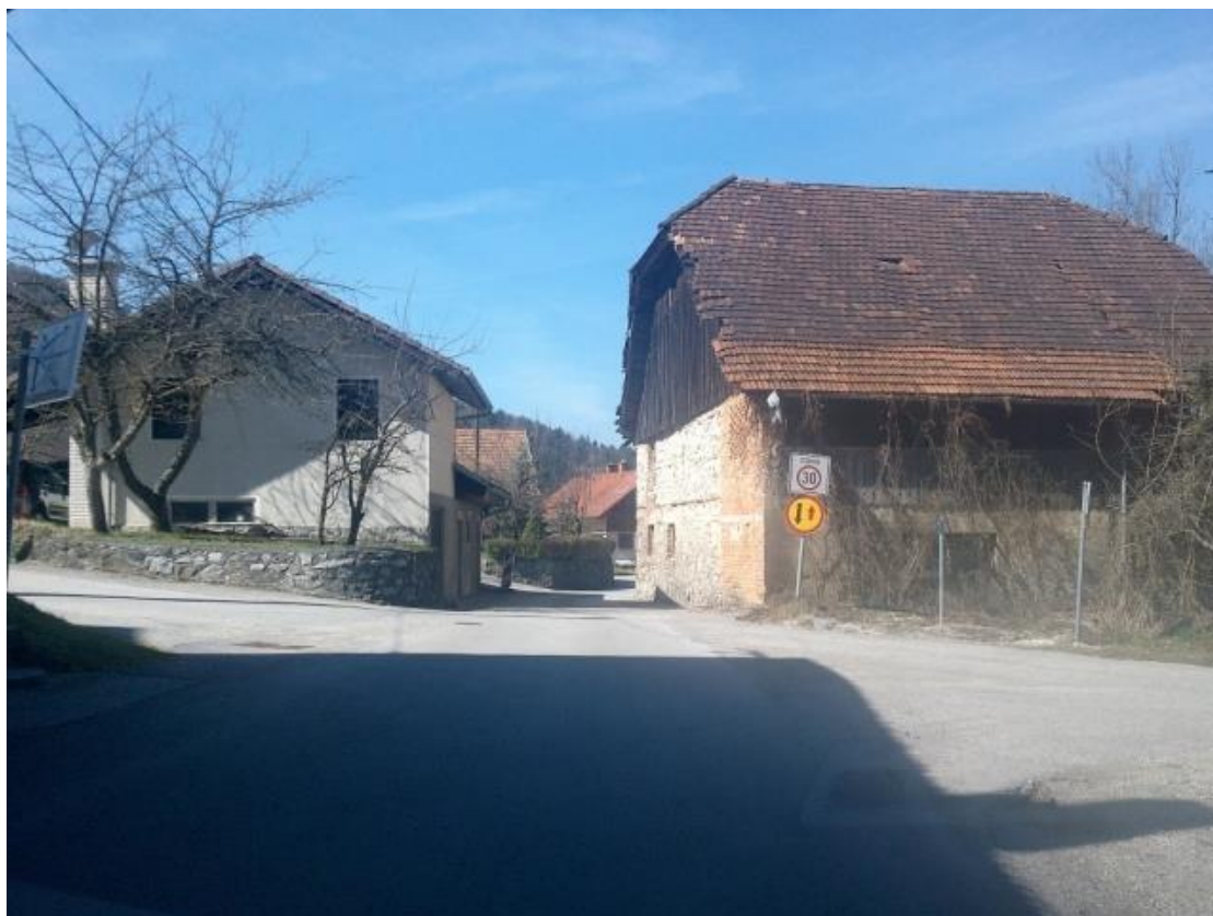
Zoženje v naselju Zamostec