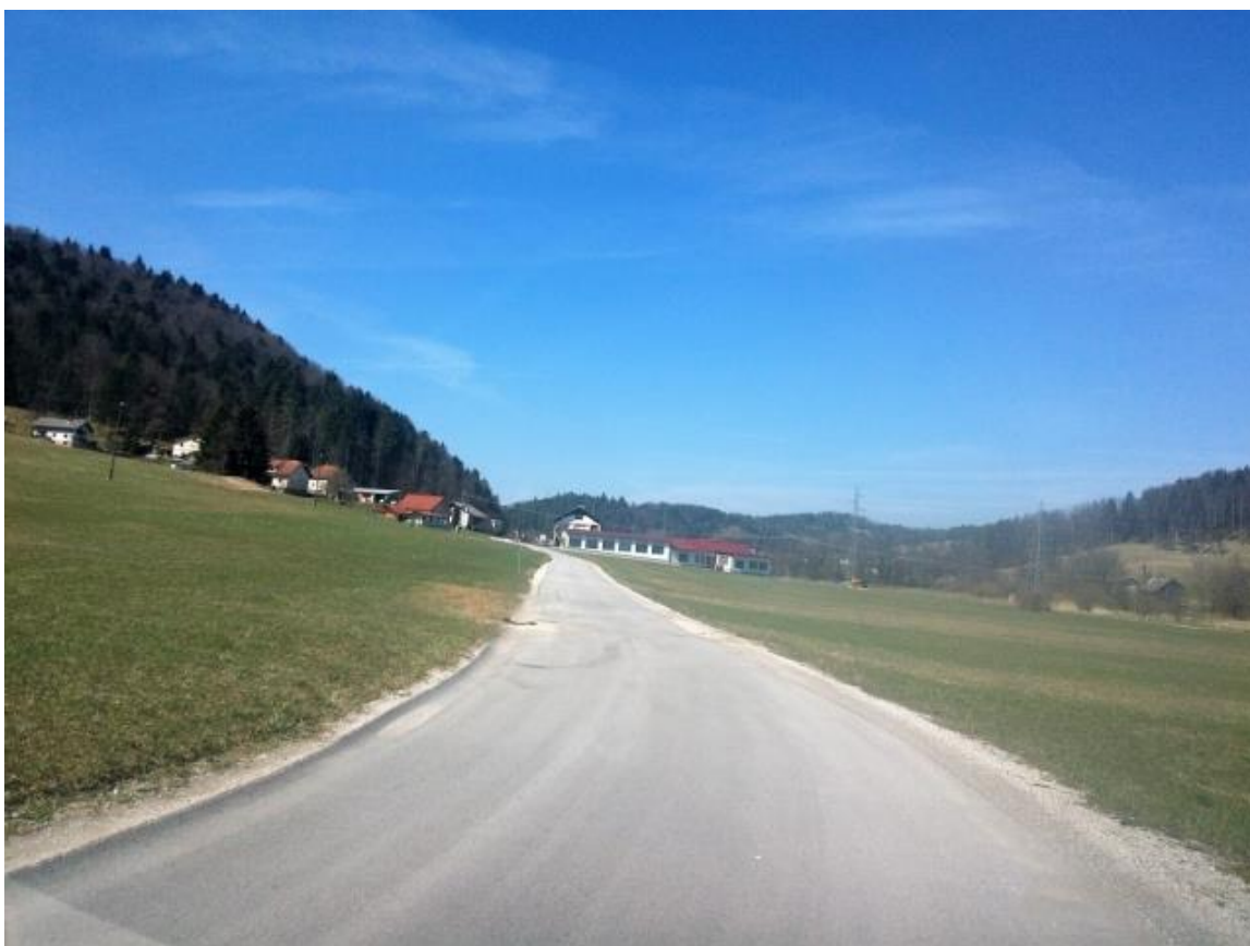
Odsek lokalne ceste med Lipovšico in Zamostcem