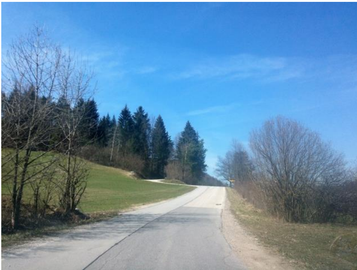
Odsek lokalne ceste med Vinicami in Lipovšico