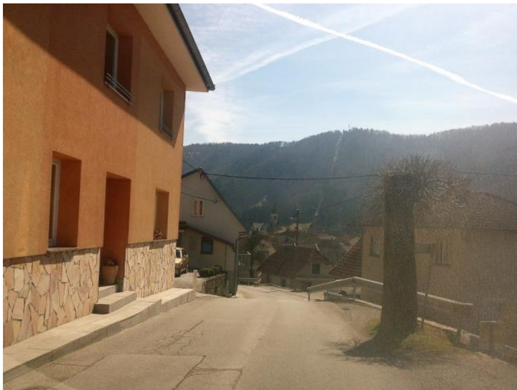
Zoženje Slemenske ceste v naselju Sodražica.

V naselju Sodražica je najbolj izpostavljena točka na zoženju Slemenske ceste pri hišni številki Slemenska cesta 6. Površine za pešce niso urejene, zaradi obstoječe cestne in obcestne infrastrukture pa je srečevanje oz. izogibanje vozil otežkočeno. Točka je opredeljena kot nevarna točka.