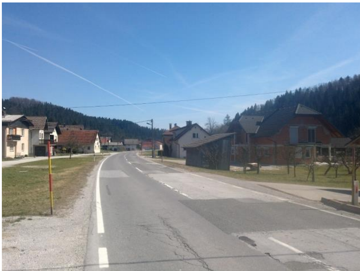
Odsek R1-212 v naselju Žimarice (po tem odseku učenci dostopajo do postajališča Žimarice)