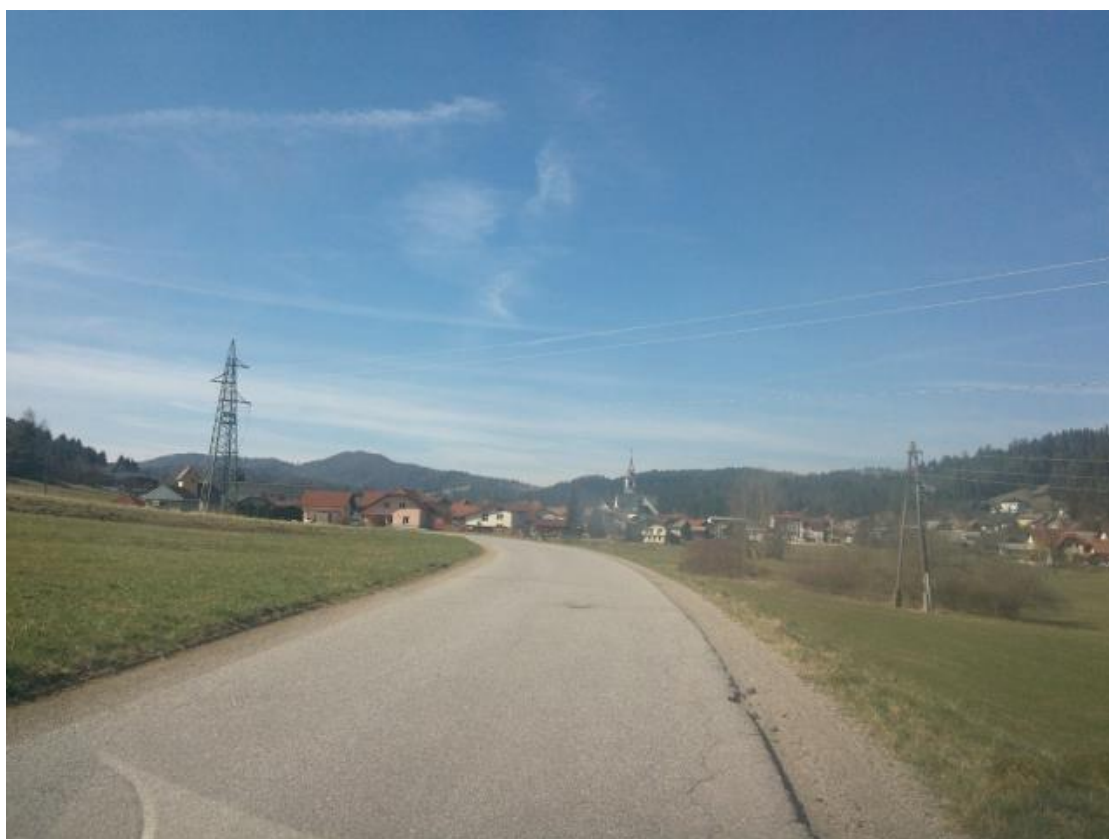
Odsek lokalne ceste med Zamostcem in Sodražico